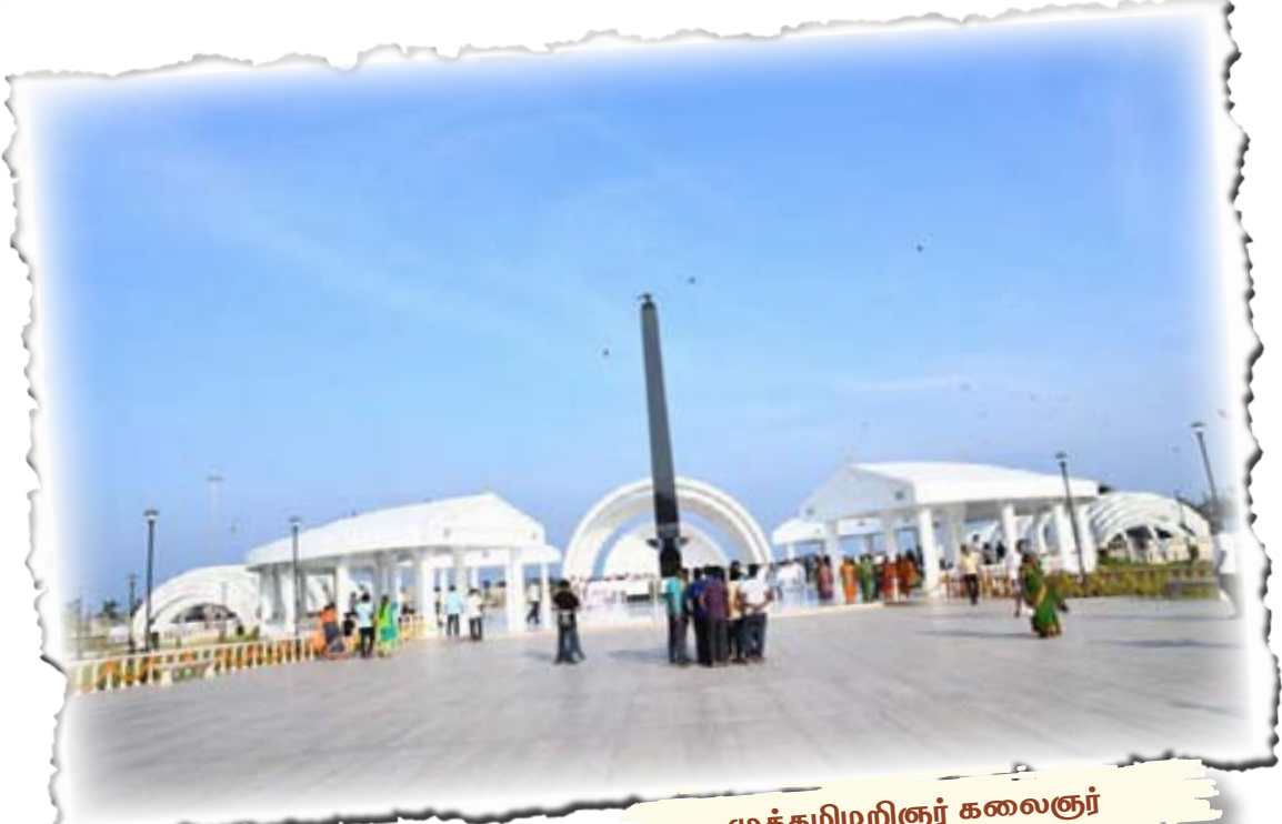
முத்தமிழறிஞர் கலைஞர் நினைவிட மத்தியத் தோற்றம்