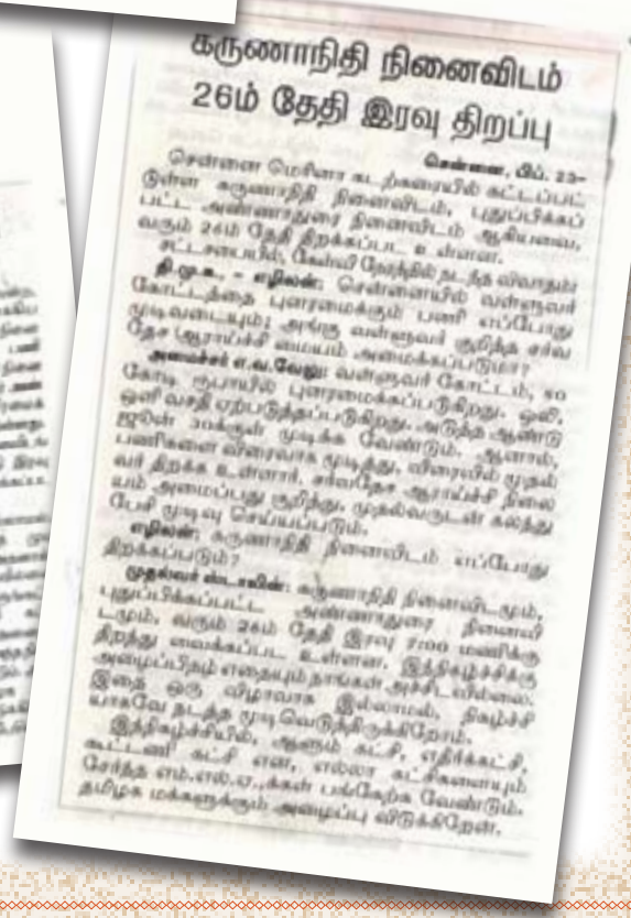
கருணாநிதி நினைவிடம் 26ம் தேதி இரவு திறப்பு