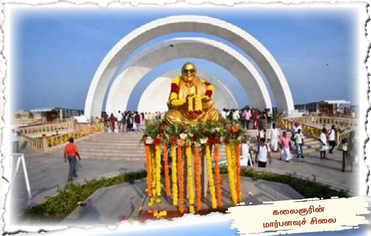
கலைஞரின் மார்பளவுச் சிலை