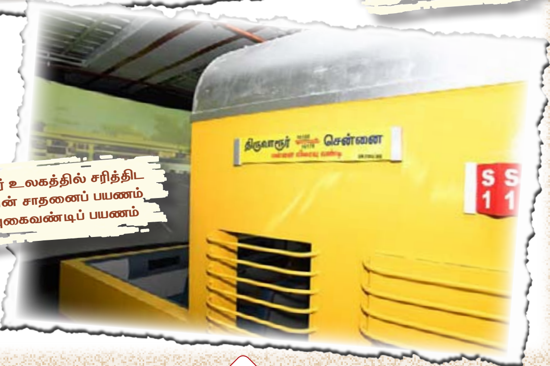
கலைஞர் உலகத்தில் சரித்திட நாயகனின் சாதனைப் பயணம் என்ற புகைவண்டிப் பயணம்