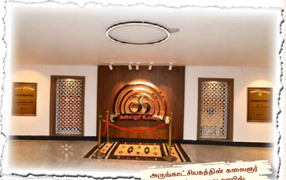
அருங்காட்சியகத்தின் கலைஞர் உலகம் நுழைவு வாயில்