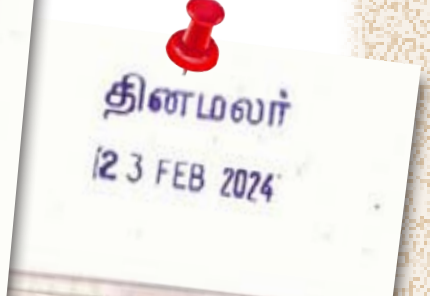
தினமலர் 12 3 FEB 2024