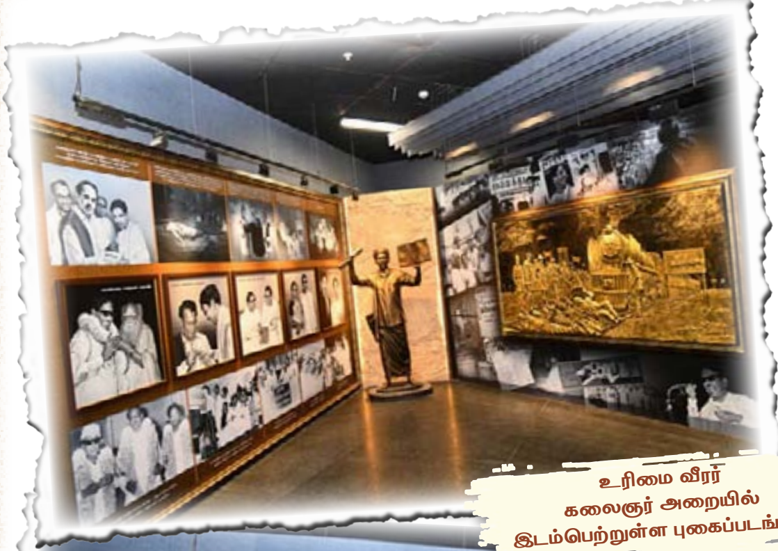
உரிமை வீரர் கலைஞர் அறையில் இடம்பெற்றுள்ள புகைப்படங்கள்