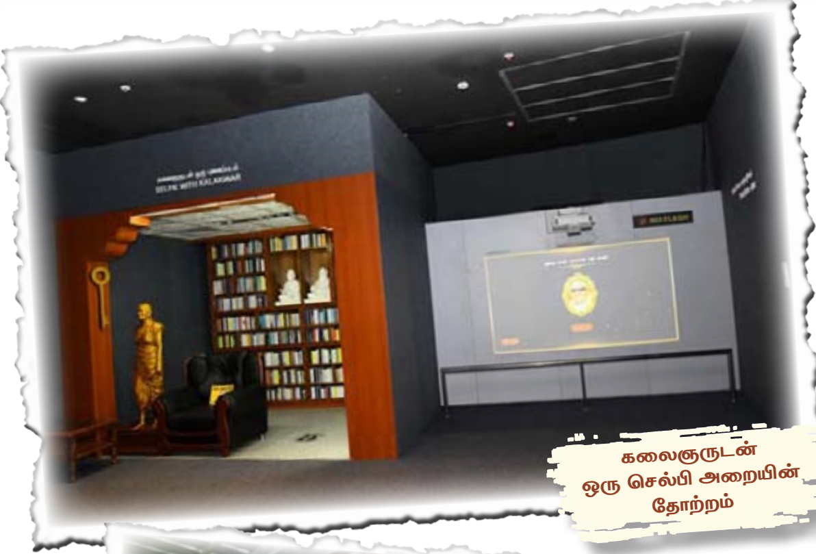
கலைஞருடன் ஒரு செல்பி அறையின் தோற்றம்