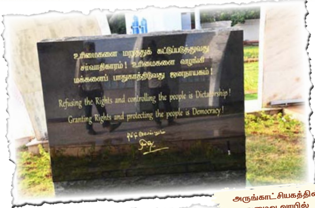
அருங்காட்சியகத்தின் நுழைவு வாயில்