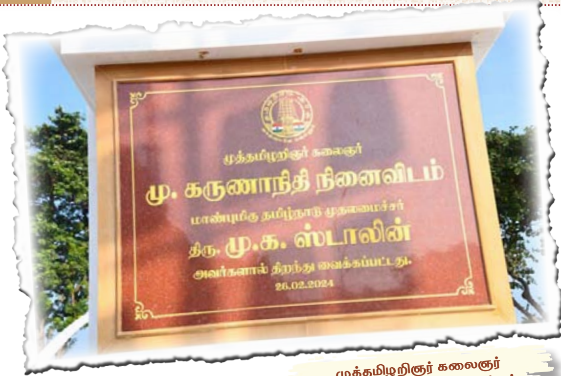
முத்தமிழறிஞர் கலைஞர் நினைவிட உட்புறத் தோற்றம்