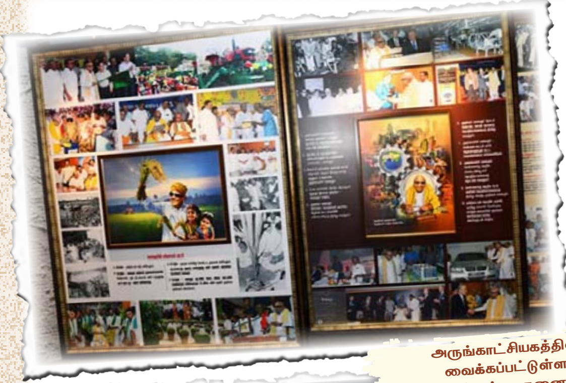
அருங்காட்சியகத்தில் வைக்கப்பட்டுள்ள திட்டங்கள், சாதனைகள்