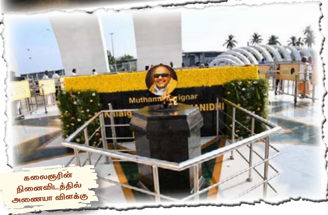
கலைஞரின் நினைவிடத்தில் அணையா விளக்கு