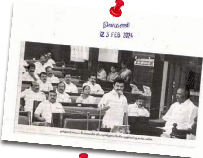
தினமணி 12 3 FEB 2024