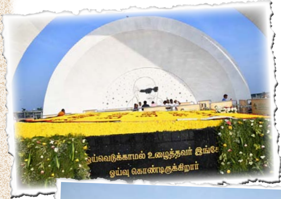
மின்னொளியில் கலைஞர் நினைவிடம்