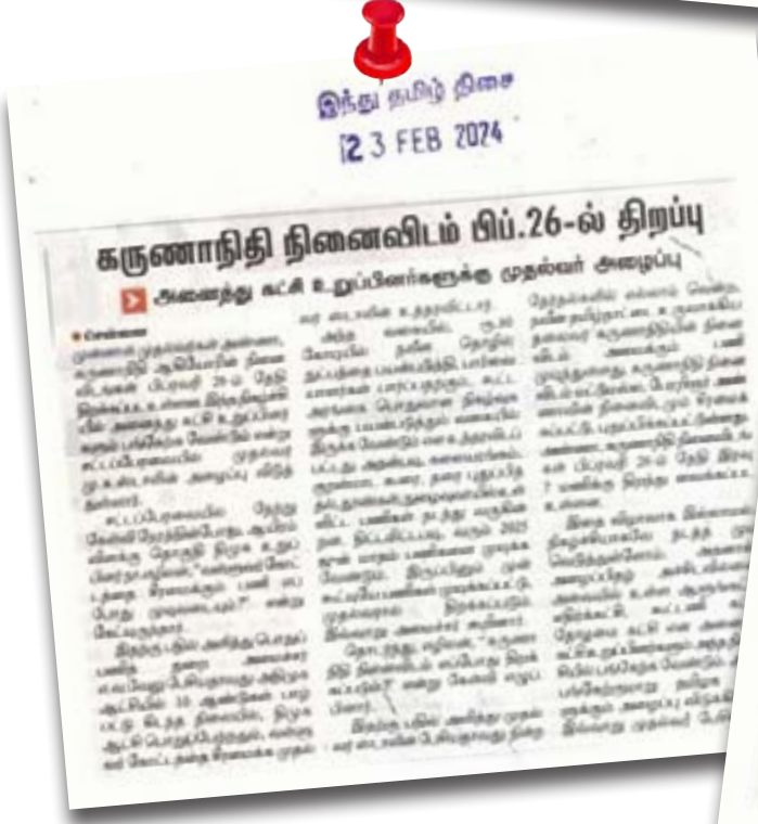
இந்து தமிழ் திசை 12 3 FEB 2024