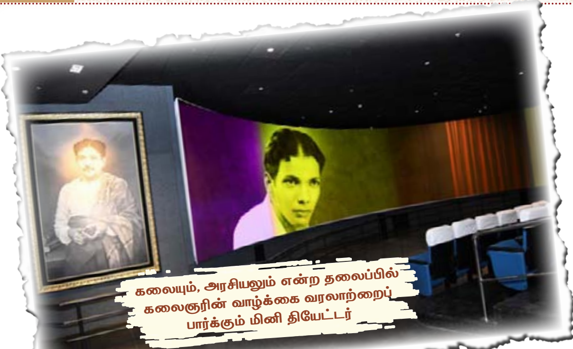
கலையும், அரசியலும் என்ற தலைப்பில் கலைஞரின் வாழ்க்கை வரலாற்றைப் பார்க்கும் மினி தியேட்டர்